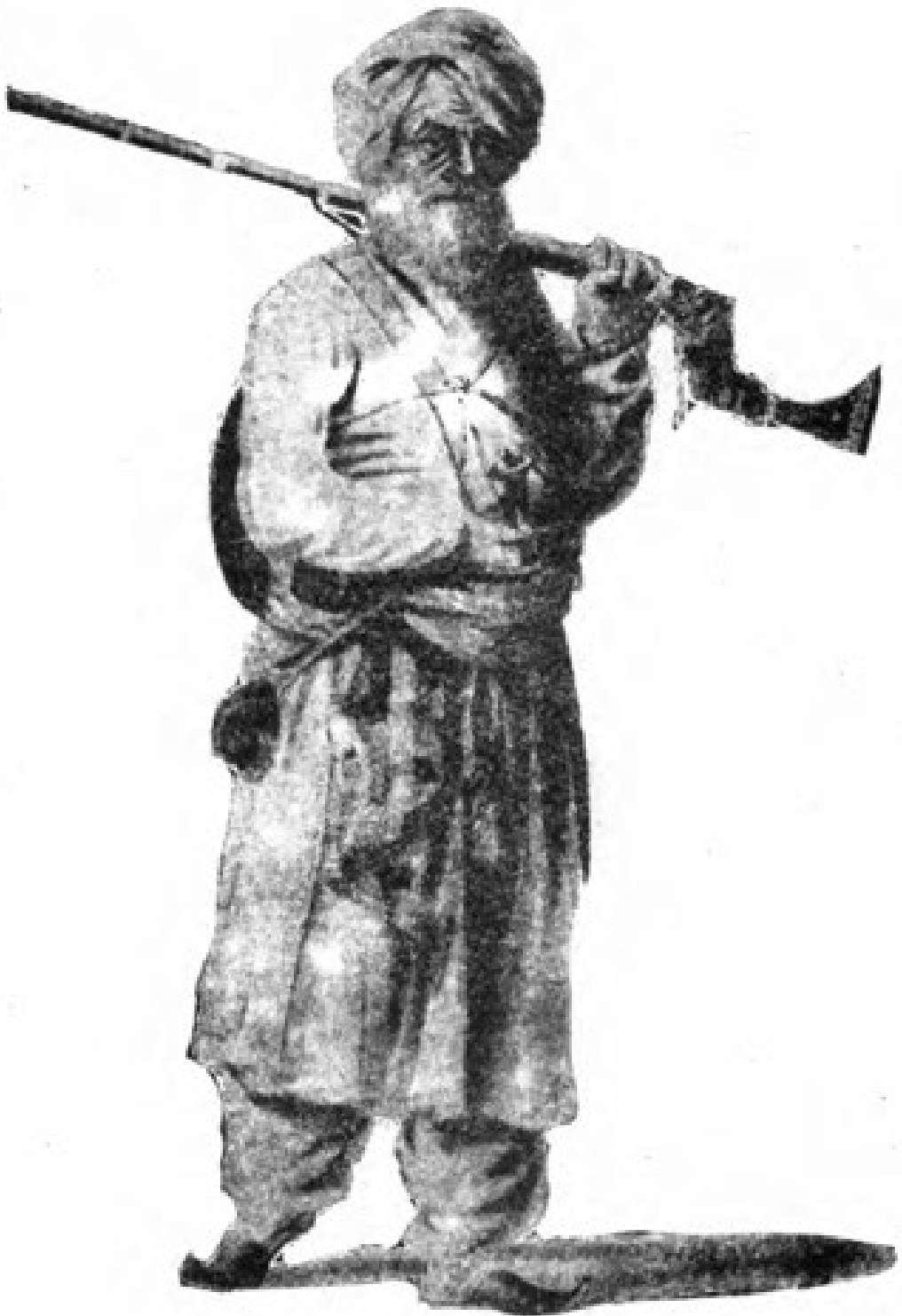
ددامان یو پښتون