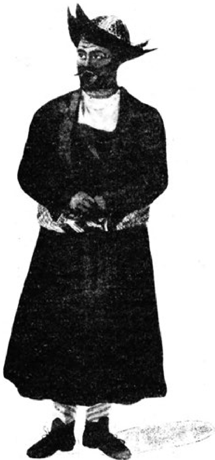
۶۶۵۰۱ یو هزاره