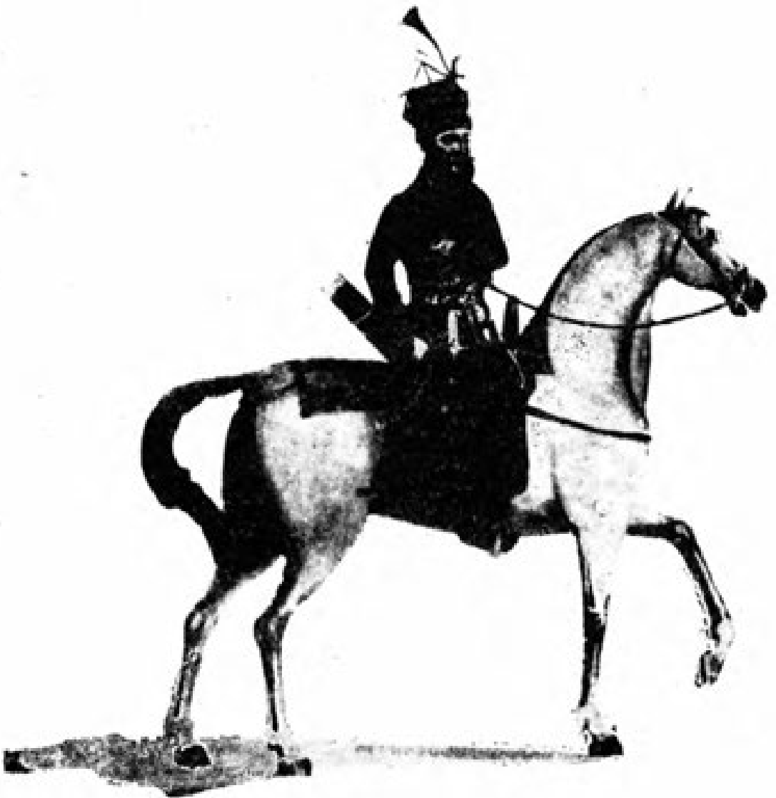
يو چاؤوس باشي پتيلو رسمى جاموگى