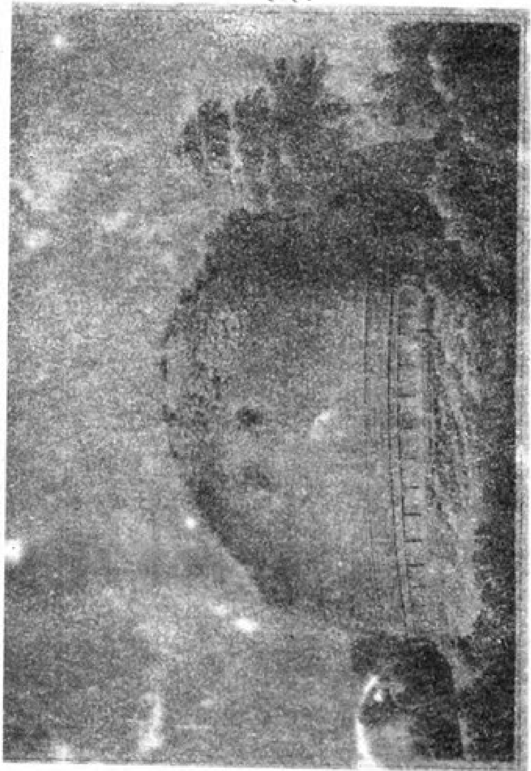
د مونیکیو لا گنبدہ