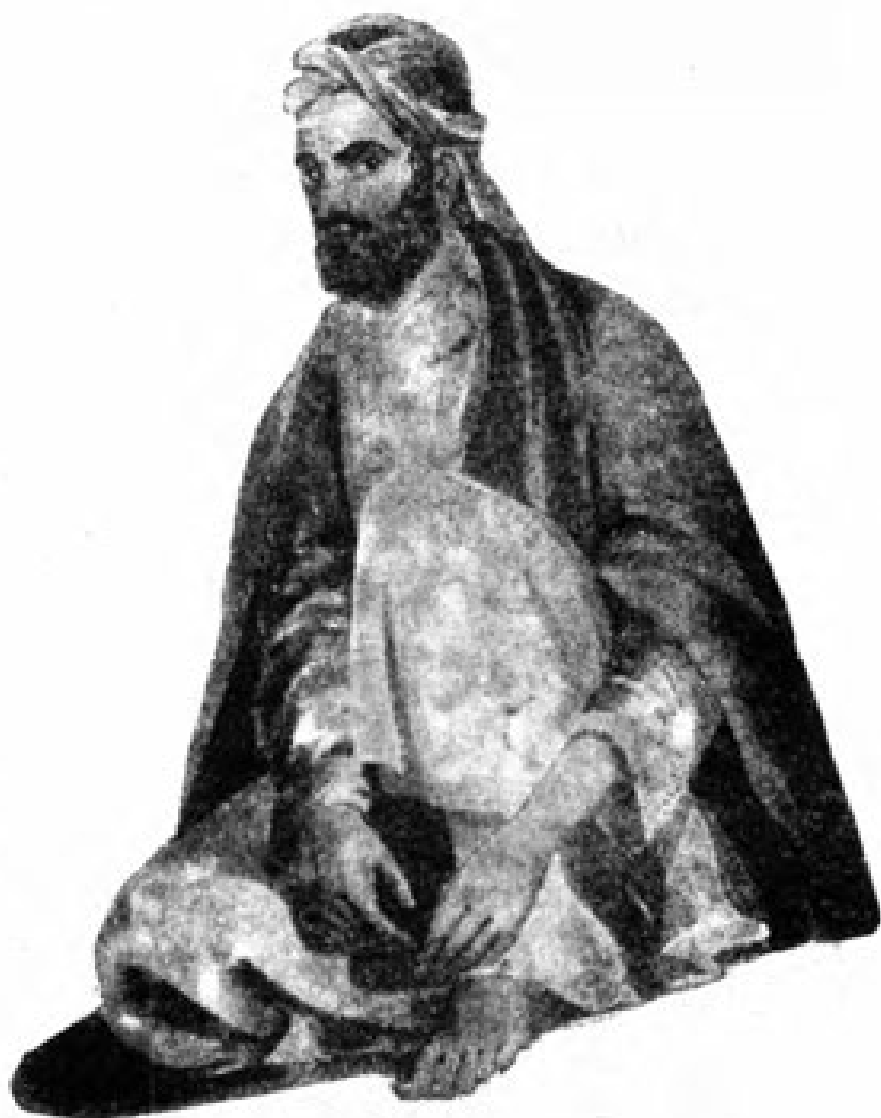
۶۶۹ یوغلجی ددوبی په جاموکی