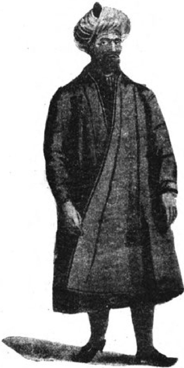
۶۶۸ د تاتاری اوزبک یو خواجه