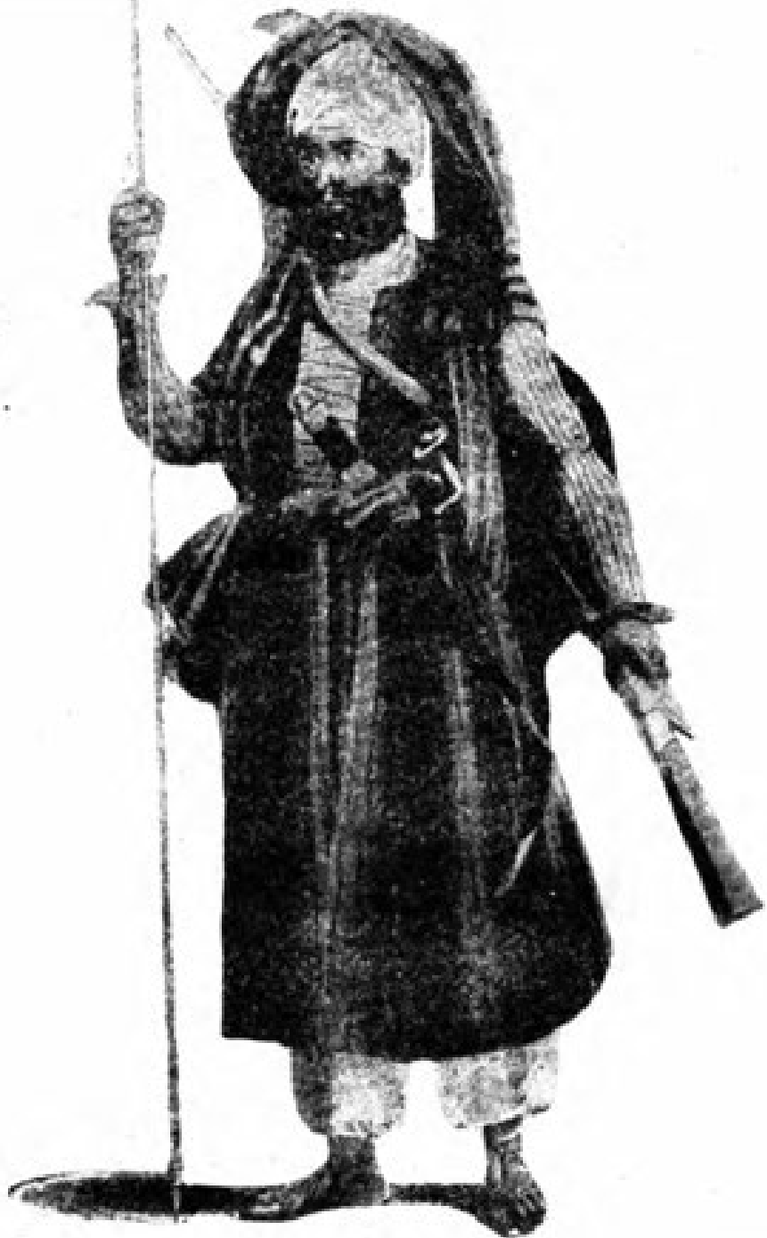
یو یو سفزی