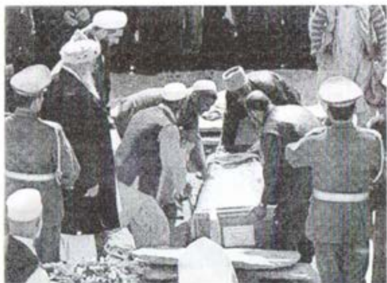
کابل، مارچ ۲۰۰۹: د محمد داود په غونډۍ کې د ارواښاد محمد داود چنازه خاورو ته د سپارلو په حال کې