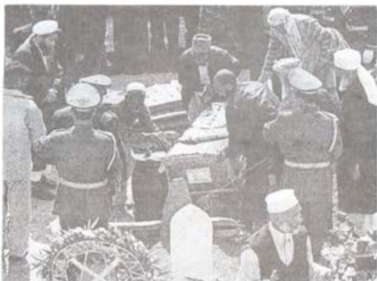
کابل، مارچ ۲۰۰۹: د ارواښاد محمد داود جنازه په دارالامان کې د محمد داود غونډۍ کې د خښولو په حال کې