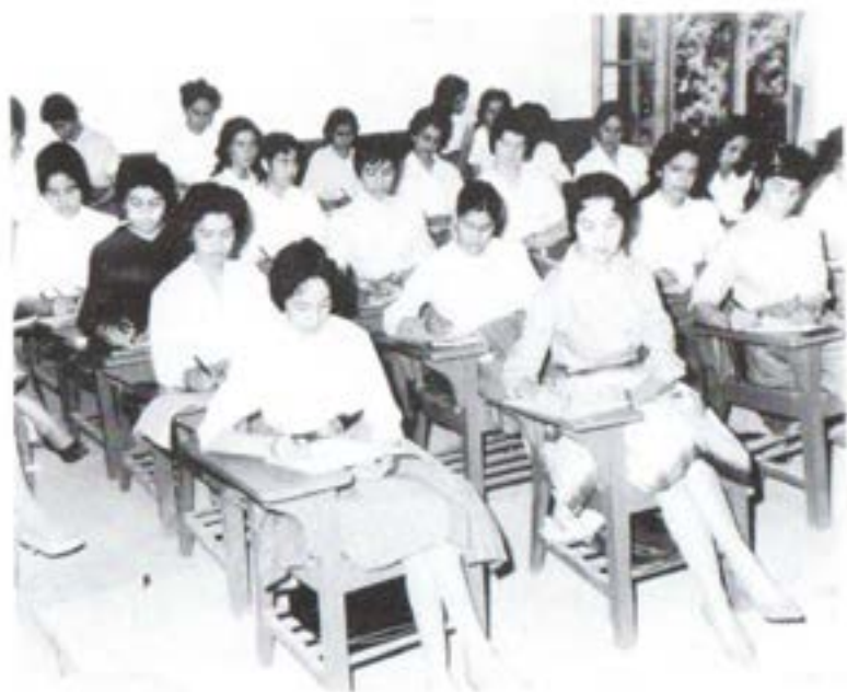
د کابل پوهنتون د ادبیاتو د پوهنځي محصلانې په کال ۱۹۶۰ کې