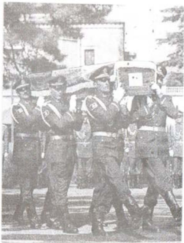
کابل، مارچ ۲۰۰۹ د افغانستان افسرانو له خوا د ارواښاد محمد داود جنازه هدیرې ته د سپارلو په لور