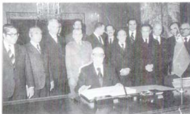
ولسمشر محمد داود دکاينې له غړيو سره