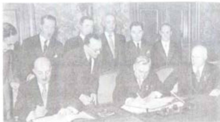
صدر اعظم محمد داود د شوروي اتحاد له مارشال بولګانین سره په ۱۹۵۵ کې د دو ستی-د ترون د لاسلیک په حال کې، له خرو شچف او محمد نعیم او نورو لوړو چارواکیو سره